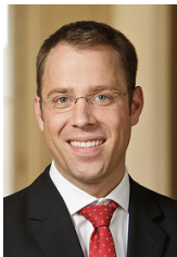
Mario Czaja MdB

Am 30.08. löste die CDU Berlin mit der Abschaffung des Straßenausbaubeitragsgesetzes ein weiteres Wahlversprechen ein. Allen voran Mario Czaja, die CDU Wuhletal sowie die Interessenvertreter der Grundstücksnutzer, z.B. der VDBG, haben seit Jahren für dieses Ziel gekämpft. Entsprechend groß war daher auch in unserem Bezirk die Freude. Berlin braucht kein Bürokratiemonster wie das Straßenausbaubeitragsgesetz, bei dem der Verwaltungsaufwand für die Beitragserhebung die Einnahmen um ein Vielfaches überstieg.