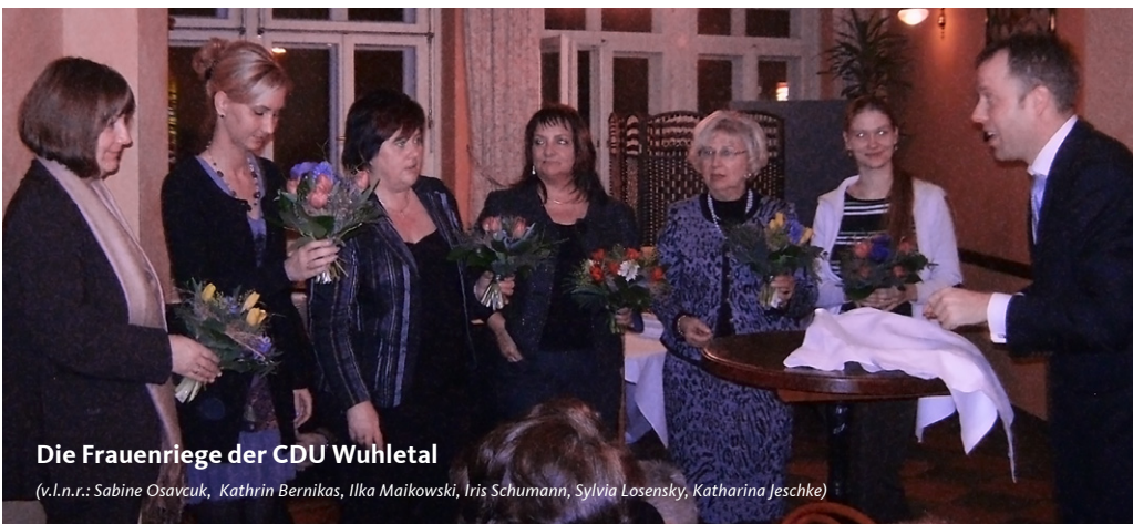
Die Frauenriege der CDU Wuhletal