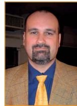
Beisitzer: Frank-Uwe Bey Kontakt PKM und Kreisverbände MIT